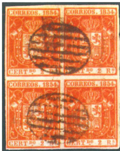
Sellos pertenecientes a la antigua colección de Burrus. Se trata de un bloque de a ocho del 2 reales de 1854 emitido por España.

Cuando fue abierto su testamento, se supo que Tapling donaba toda su colección al Museo Británico de Londres con las condiciones de que no se mutilara y se expusiera