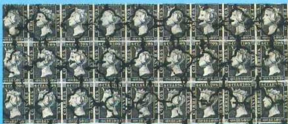
Ferrari adquirió para su colección un bloque del famoso 6 cuartos de Isabel II, que fue la primera emisión realizada por España en 1850. Este bloque (arriba fragmento), que cuenta con un matasellos de araña negra, se halla extraordinariamente bien conservado.

Jamás vendió un solo sello y sólo cambió algunos. Por ello, a su muerte, acaecida en 1917, su legado era impresionante. En su testamento, dejó toda su colección al Museo Postal de Berlín. Pero el gobierno francés no respetó su voluntad: secuestró la colección y mandó vender sus sellos en pública subasta, embolsándose la recaudación a cuenta de las reparaciones exigidas a Alemania tras la primera guerra mundial. A lo largo del presente siglo, las joyas de esta colección han pasado por varias manos, revalorizando continuamente su valor.